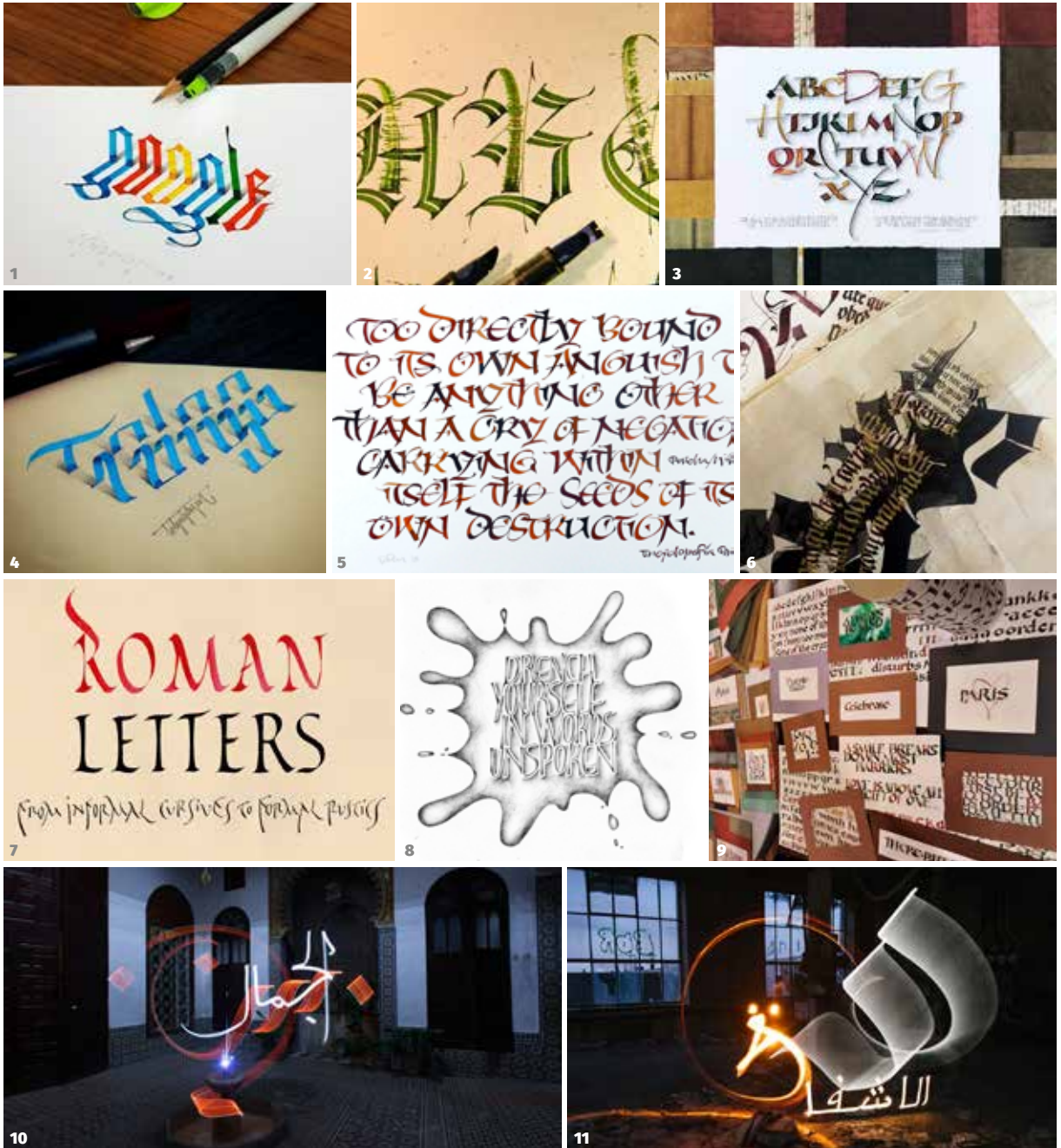
1 3D CALLIGRAPHY by Tolga Girgin | 2 MORE THAN BLACK LETTER calligraphy by Rainer Wiebe | 3 BOLD AND BLENDED calligraphy by Amity Parks | 4 3D CALLIGRAPHY workshop by Tolga Girgin | 5 LOSING CONTACT calligraphy by Carl Rohrs | 6 FROM BLACK TO ASHES calligraphy by Claudio Gil | 7 FROM INFORMAL ROMAN CURSIVE TO FORMAL RUSTICS calligraphy by Andrea Arcangeli | 8 SHARP PENCIL calligraphy by Amity Parks | 9 AMITY PARKS students work | 10 beauty by Julien Breton | 11 PAINTING WITH LIGHT calligraphy by Julien Breton

Schwimmen, Klettern oder Fahrradfahren, damit auch die Partner aller Teilnehmer eine schöne Zeit verbringen können, ohne sich zu langweilen.